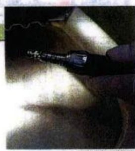
作図 デザイン 藤田 浩